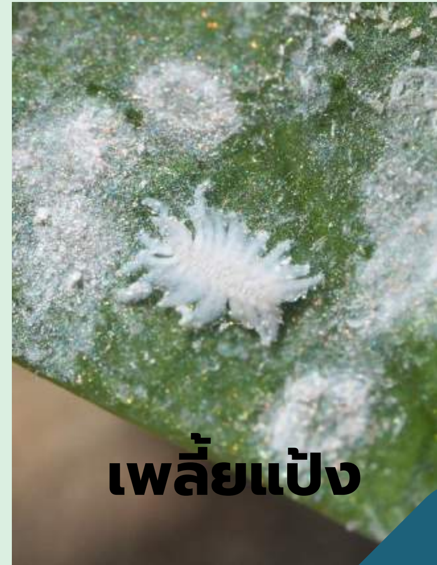
เพลี้ยแป้ง