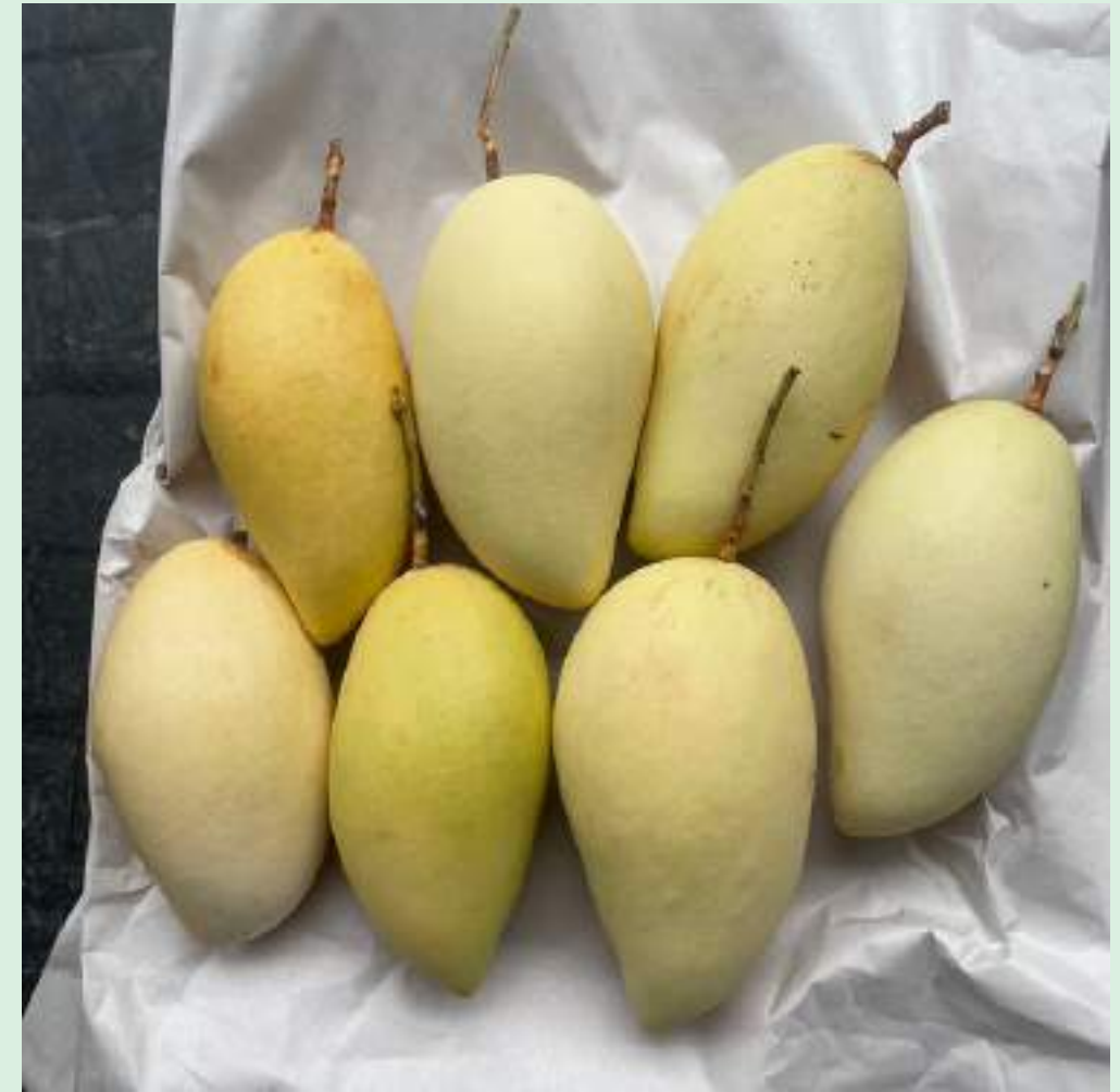
มะม่วงส่งออก เกรด AB