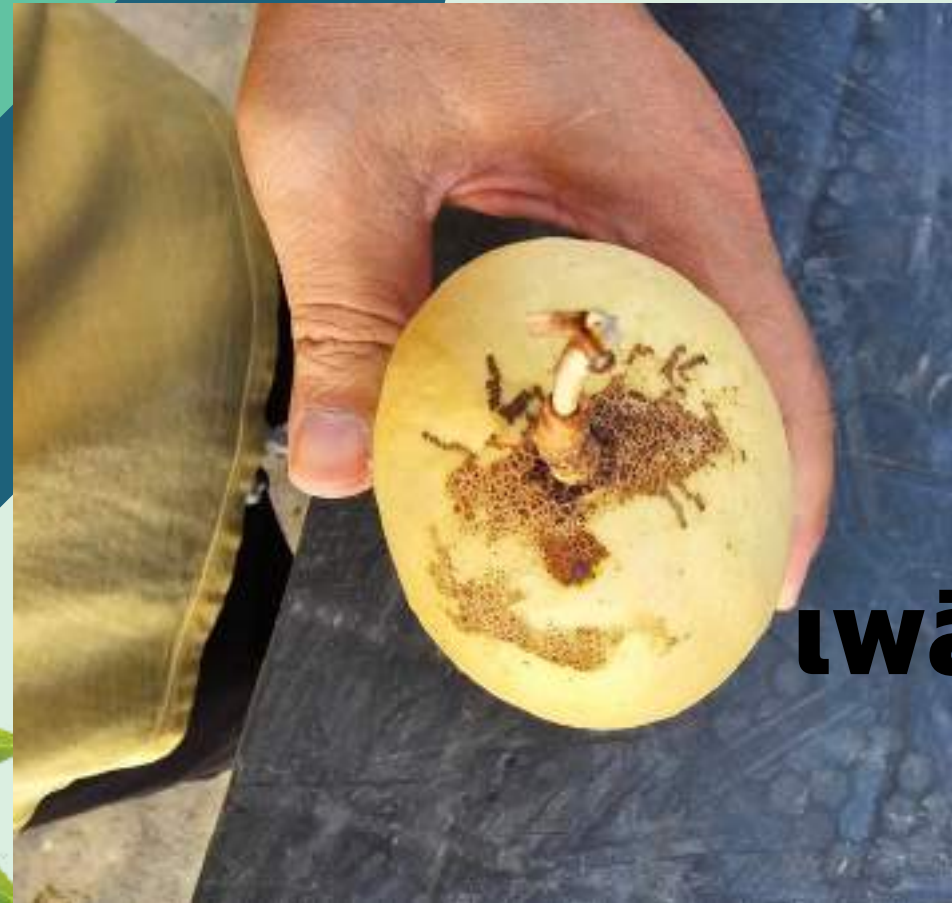
เพลี้ยไฟ