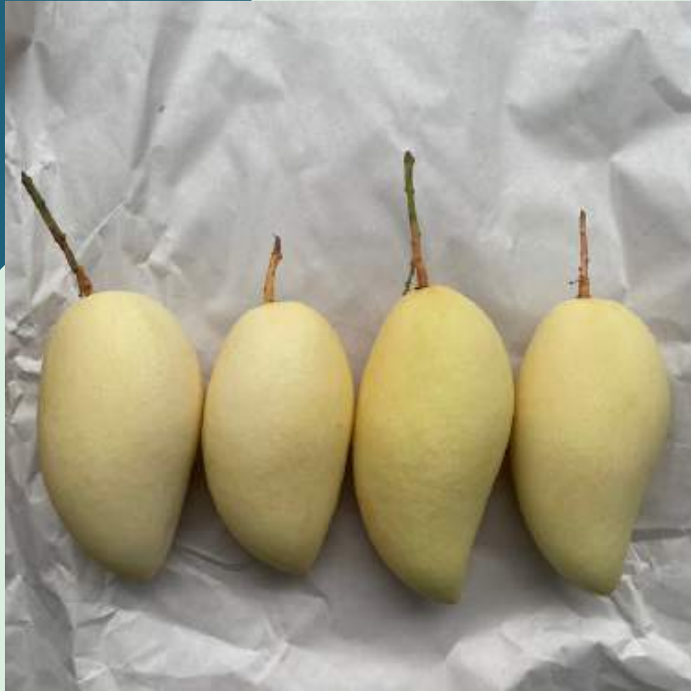
มะม่วงส่งออก เกรด A