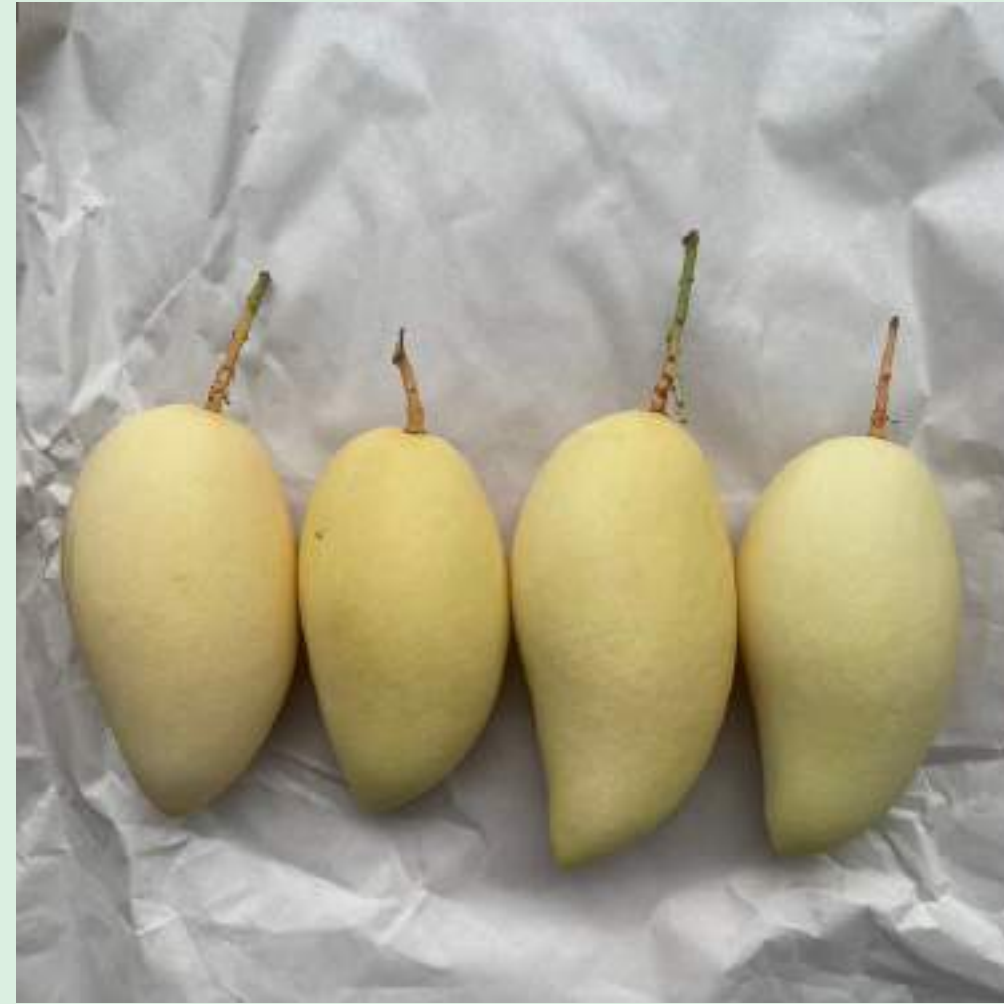
มะม่วงส่งออก เกรด A