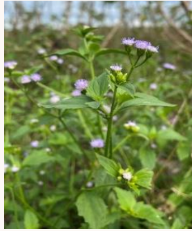
ต้นสาบม่วง