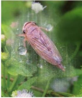
เพลี้ยจักจั่น