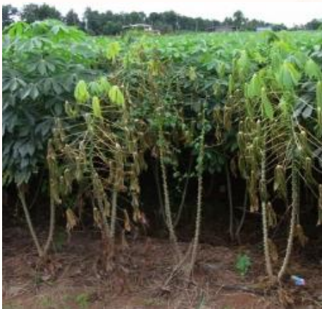
อาการเหี่ยวเหลือง

ต้นมันสำปะหลังที่อยู่เหนือดินจะพบว่า ใบมันสำปะหลังแสดงอาการเหี่ยวเหลือง โคนต้นเน่าเป็นสีน้ำตาลหรือดำ มันสำปะหลังบางพันธุ์โคนต้นจะมีการสร้างรากค้าชูตรงรอยแตกของโคนต้นเมื่อถอนขึ้นมาหัวมันสำปะหลังแสดงอาการเน่า ถ้าผ่าหรือหักหัวมันสำปะหลังจะเห็นภายในสีน้ำตาล ในมันสำปะหลังบางพันธุ์มีอาการเน่าที่โคนและส่วนหัวที่อยู่ใต้ดิน โดยที่ส่วนของลำต้นและใบยังมีลักษณะปกติ หรือบางพันธุ์ถ้าอาการรุนแรงมันสำปะหลังอาจยืนต้นตายได้