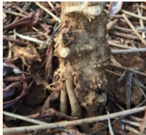
สร้างรากค้าชูตรงรอยแตกของโคน