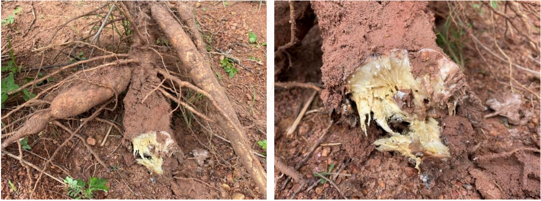
หัวมันสำปะหลังแสดงอาการเน่า