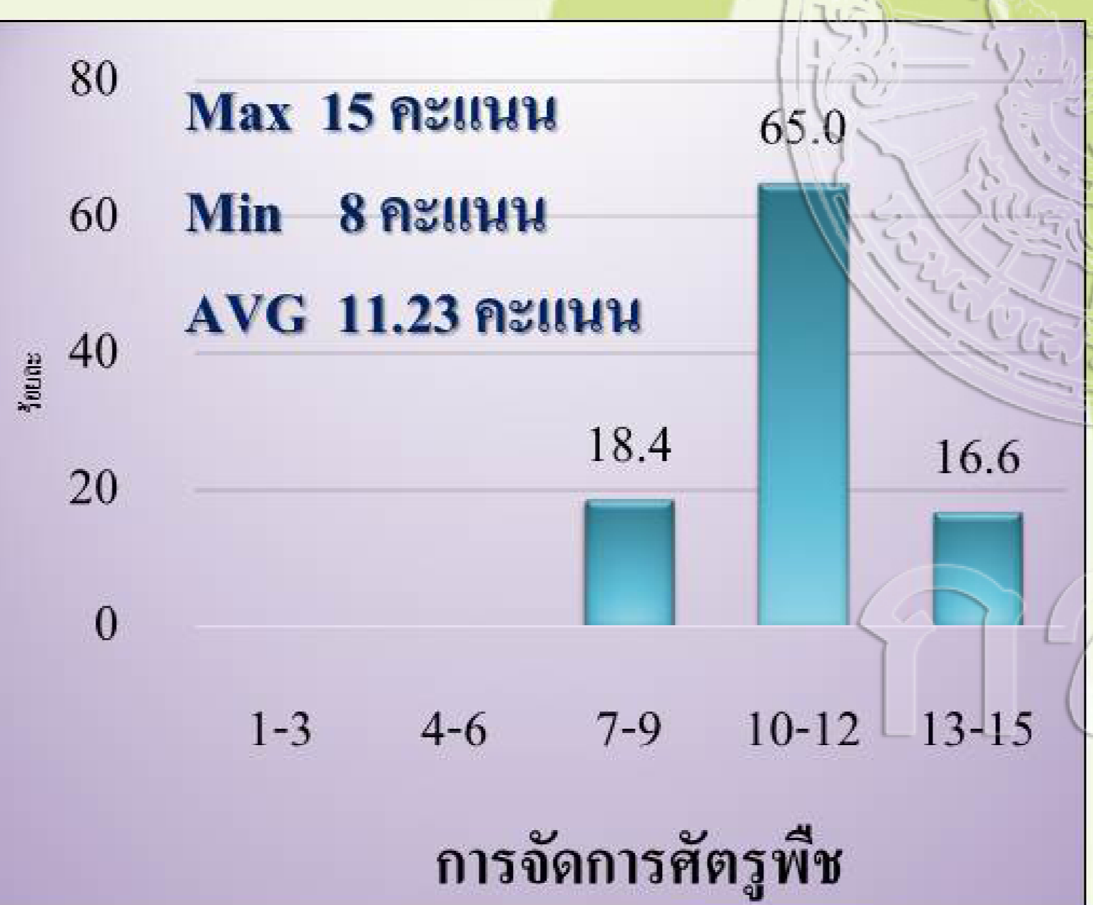
รูปที่ ๑ ความรู้ความเข้าใจของสมาชิกในหลักการดำเนินงานศูนย์